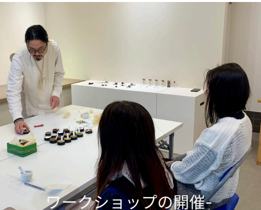
ワークショップの開催