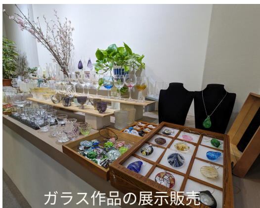
ガラス作品の展示販売