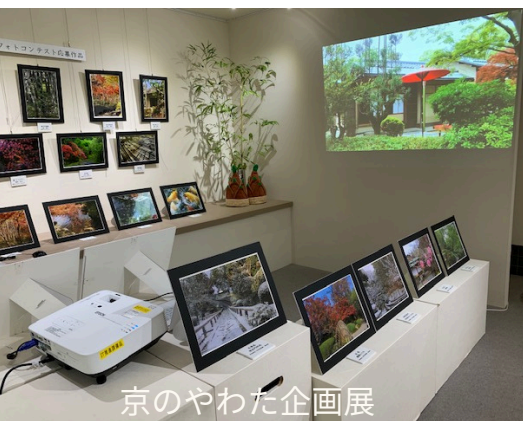
京のやわた企画展

絵画・写真などの作品展、ワークショップ、セミナーの開催、 マルシェ、農産物、特産品の販売など幅広くご利用になれます。 ただし、調理を伴う催しは、ご利用になれません。